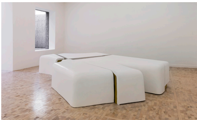
Second Choices (Sample B) , 2015