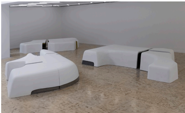
Second Choices (Sample B), (Sample C), (Sample D) , 2015