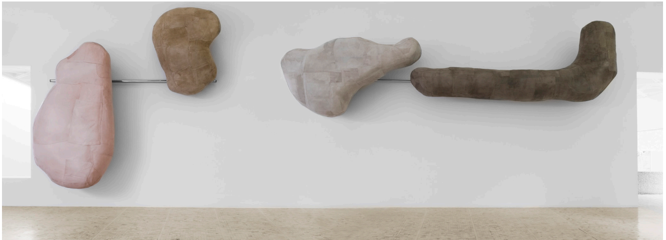
Chin up , 2015