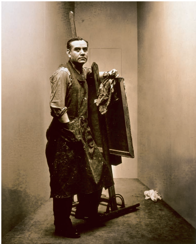
Rufino Tamayo, fotografiado por Irving Penn para Vogue , 1947