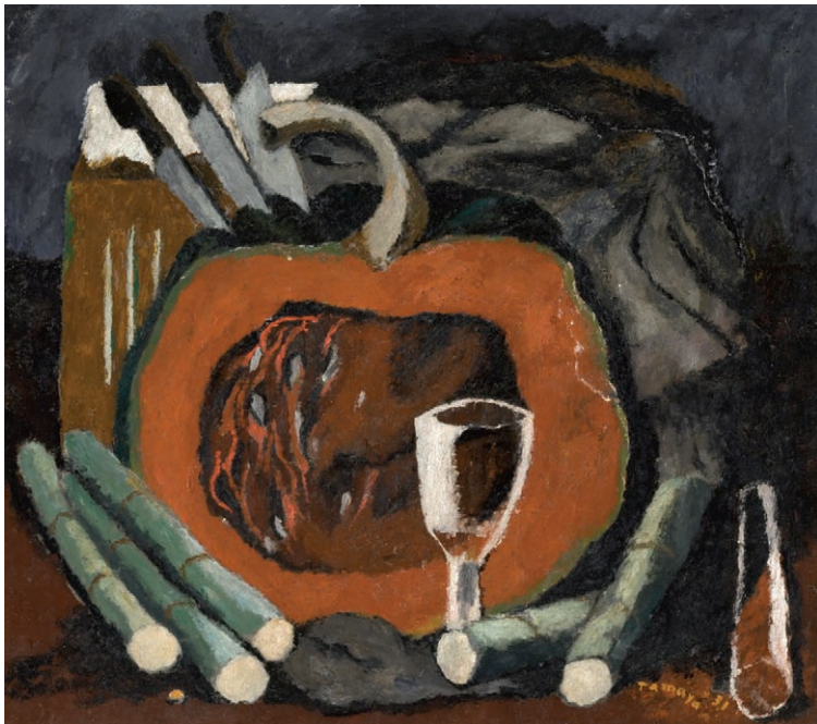
Naturaleza muerta con calabaza y cañas de azúcar , 1931. Óleo sobre tela. 49.5 x 54.5 cm. Colección de Arte Mexicano de Bernard y Edith Lewin del Museo de Arte del Condado de Los Ángeles (LACMA). Imagen digital © 2012 Museum Associates / LACMA. Licencia de Art Resource, NY