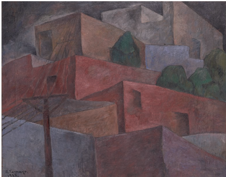
Pueblo , 1925. Óleo sobre tela. 60 x 75 cm. Berkeley Art Museum and Pacific Film Archive at University of California, Berkeley, San Francisco, California.