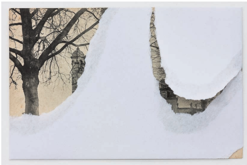
Cyprien Gaillard. Nuevo pintoresco , 2012 Postal, papel

La obra de Cyprien Gaillard es un gesto hacia diversas formas de lo sublime, cercana tanto a los Románticos como a la obra de Robert Smithson. Aunque su estrategia se inspira en la idea del vandalismo y la ruina. Estas relaciones le interesan para hablar de la irreversibilidad del paso del tiempo (entropía) en la representación del paisaje. Su video Real Remnants of Fictive Wars II (Remanentes reales de guerras ficticias, 2004) coloca al espectador en el centro de un túnel de ferrocarril rodeado de un paisaje agreste, en donde una nube de niebla cubre la imagen hasta dejarla en blanco para pronto revelarla de nuevo. En su serie New Picturesque (Nuevo pintoresco, 2012) Gaillard desprende la mayor parte de la imagen de postales encontradas para dejarlas casi en blanco y cuestionar la noción de lo pintoresco que en el Romanticismo se entendía como “lo digno de ser representado”.