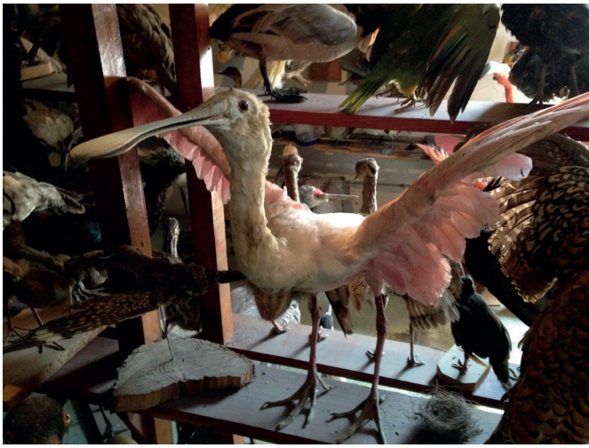
Taxidermia de espátula rosada Fotografía de investigación

Mientras investigaba para este proyecto, me encontré con una increíble colección taxidérmica de aves. Estaba muy entusiasmado de ver un ejemplar de espátula rosada de cerca y estudiar sus plumas y pico. La experiencia de haber visto esta colección me causó un gran impacto, pues supe cómo quería que el proyecto funcionara visualmente: incorporando las 4 especies de aves que conforman el tocado mejor conocido del arte plumario, el Penacho de Moctezuma.