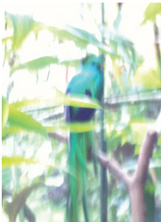
Fotografía de un quetzal en su hábitat natural tomada por Eduardo Sarabia

Serpiente emplumada y otros festejos es la instalación más reciente de este artista, surgida a partir de una fascinación personal por el quetzal, misma que detonó una serie de encuentros, controversias, historias, intercambios y procesos de producción aquí comentados, que lo llevaron a materializar esta obra.