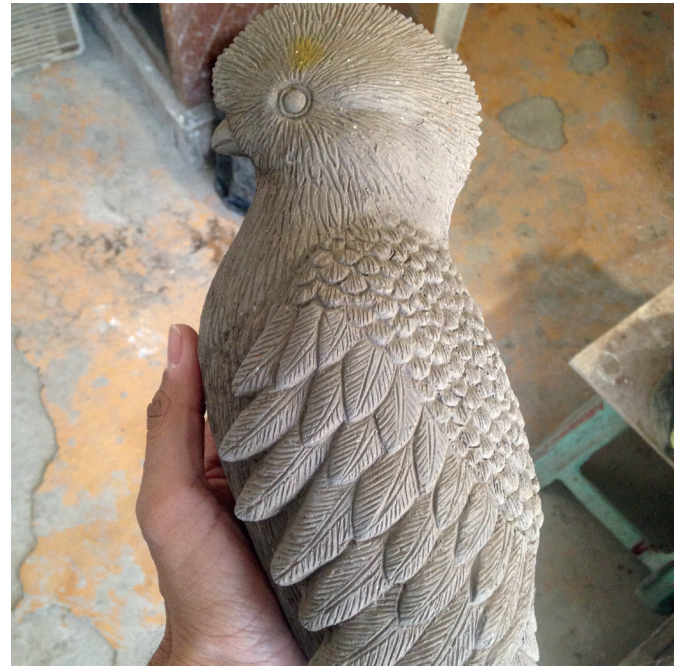
Quetzal de barro cocido Fotografía del proceso de producción

Este fue el primer quetzal que salió de un horno que construimos en Tonalá, Jalisco. Cuando empecé a trabajar en el modelo me di cuenta de que muy pocas personas han visto un quetzal real, por lo que lo hice más grande que su tamaño normal. Me preocupé entonces por las plumas de su cola, supe que en barro serían muy delicadas y frágiles. Inmediatamente empecé a trabajar en pruebas con diferentes materiales y finalmente escogí hacerlas con artesanos que trabajan el cuero en Jalisco. Cada pluma de la cola es única, cortada a mano, marcada y pintada sobre el mismo cuero.”