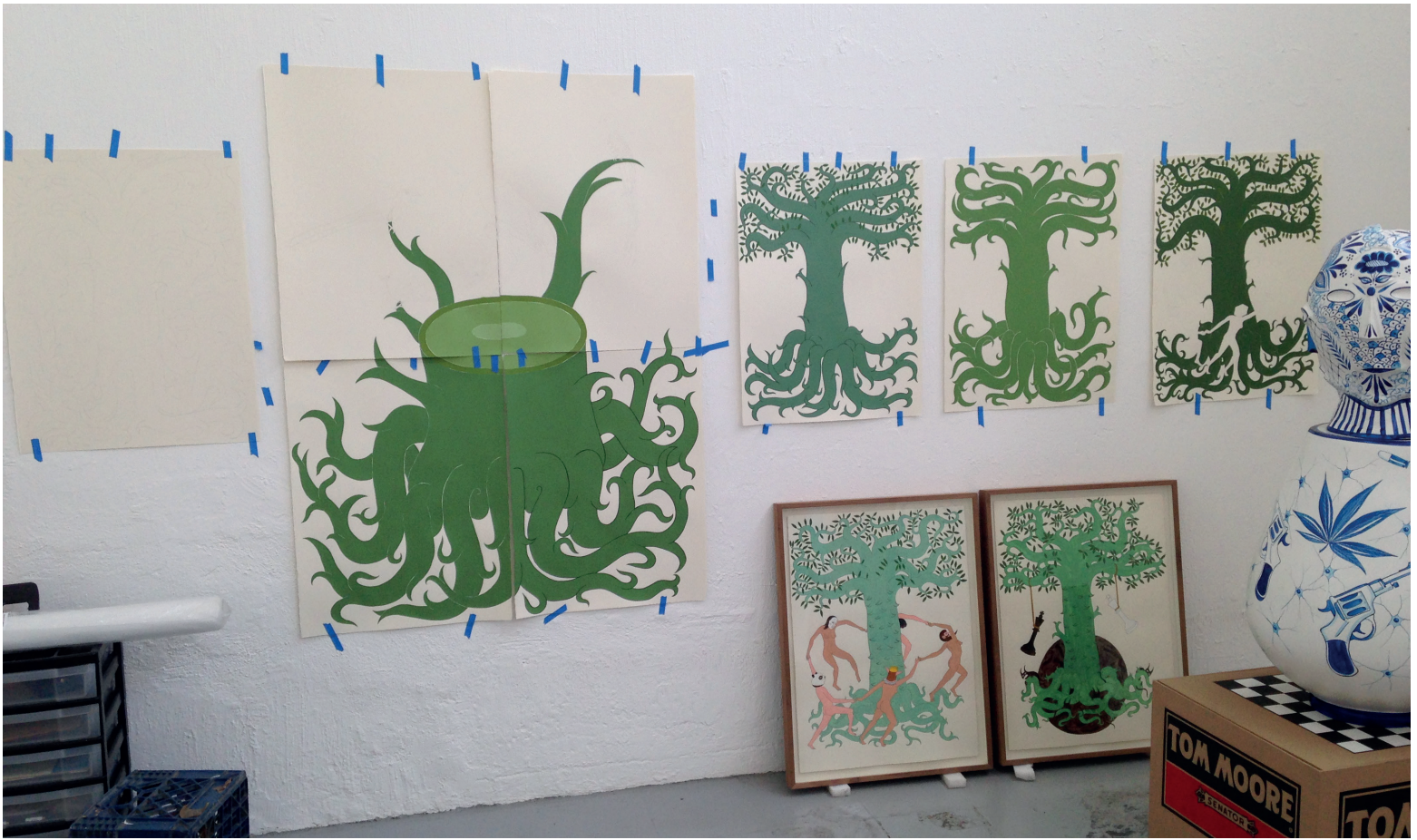
Obras en proceso para Serpiente emplumada y otros festejos Estudio Eduardo Sarabia Guadalajara, Jalisco, 2016

He estado dibujando ceibas por algún tiempo. Siempre me ha gustado su forma y su manera agresiva de sobrevivir, con esas afiladas espinas en su exterior. Para muchas culturas indígenas es un árbol sagrado y juega un rol importante en sus mitologías. Mientras planeaba esta exposición, me pareció importante hablar sobre mitos actuales y relacionarlos con mitos antiguos. Trabajé en todas estas ceibas al mismo tiempo y me aseguré de que cada una tuviera una forma y un color único, cerciorándome también de que las festividades, eventos y rituales que suceden a su alrededor se complementaran entre sí. El dibujo principal, más grande que el resto, es un homenaje a todas las ceibas que han sido taladas. El quetzal, cuco ardilla, espátula rosada y cotinga azul, descienden sobre él para mostrar respeto a su sagrado amigo.